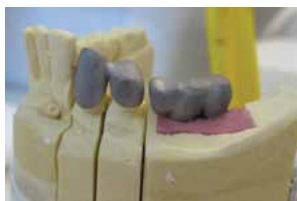
5. kép A fogakra és az implantátumokra épített különálló hidak