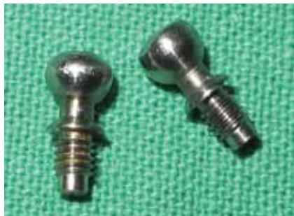
2. kép Az implantátumokról információ szolgáltató fej részek