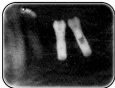
1. kép Behelyezett implantátumok, gömb fejfel