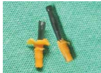
3. kép Az implantátumok belsejéről készített minták