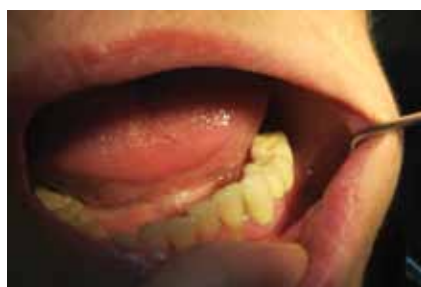
6. kép Az elkészült fogak