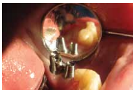
4. kép Az implantátumba behelyezett egyenes és tengelykorrekciós fejek